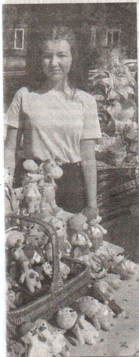
Я в гости к бабушке вые вязанные игрушки