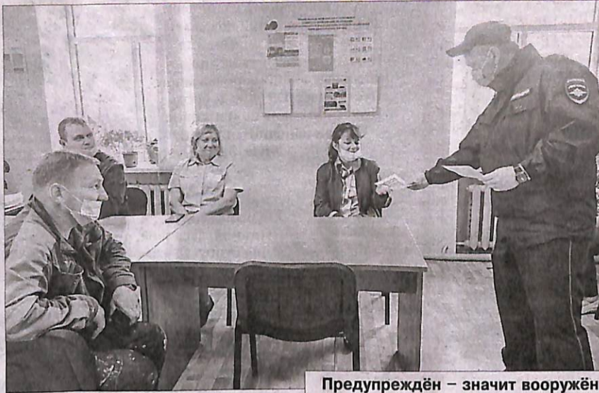
Предупреждён – значит вооружён.

На железнодорожном вокзале станции Коноша-1 прошла акция «Кибермошенничество. Будьте внимательны!», в рамках которой сотрудники транспортной полиции рассказали гражданам, как избежать мошеннических уловок и безопасно использовать киберпространство.